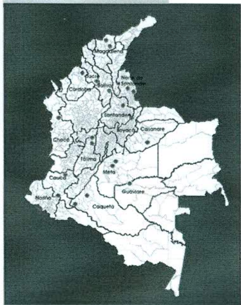
Ceres Intervenidos por Fundautónoma

Apoyar el Fortalecimiento o la Redefinición de las Alianzas que respaldan los Centros Regionales de Educación Superior.